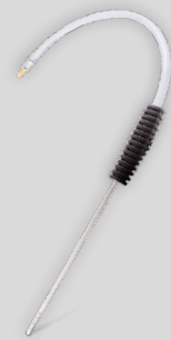
Dízel DPF Szonda J02256