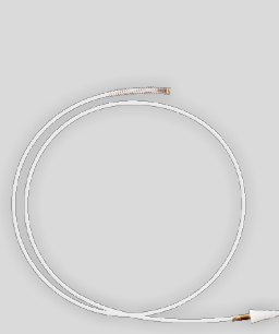
Dízel DPF Tömítő és Kúpos szórófej J02254