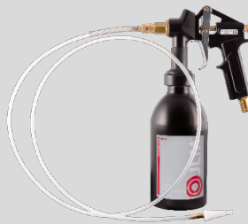
DPF Tisztító Készlet J02250