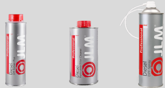
Dízel DPF Regeneráló Plusz 250 ml / J02200 Részecskeszűrő Tisztító 375 ml / J02210 DPF Spray 400 ml / J02220