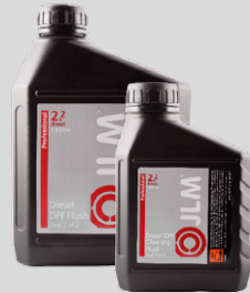
Dízel DPF Tisztító és Öblítő Folyadék szett J02230