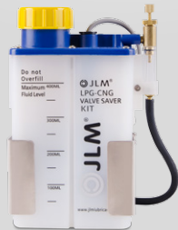
Szelep Védő Készlet J01310