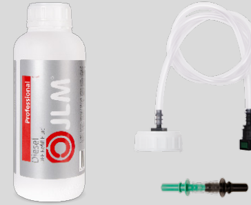
Dízel DPF Utántöltő Folyadék 1 liter / J02260 DPF Utántöltő Készlet J02270