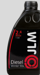
Dízel Dermedésgátló 1 liter / J02450