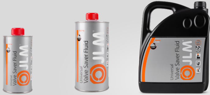
Szelep Védő Folyadék 500 ml / J01230 Szelep Védő Folyadék 1 liter / J01250 Szelep Védő Folyadék 5 liter / J01270