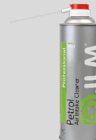
Benzin EGR és Légbeömlő Tisztító 500 ml / J03140